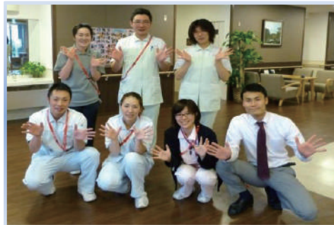
←すみだ明生苑の職員と施設長

達職員が楽しい時間を共有させて頂く事は、職員にとっても大きなやりがいに繋がり、入居者様との信頼関係を構築する機会にもなります。これからも、こういった取組みが入居者様にとっての楽しみや生きがいとなり、働く職員にとってもやりがいとなるように努力して参ります。